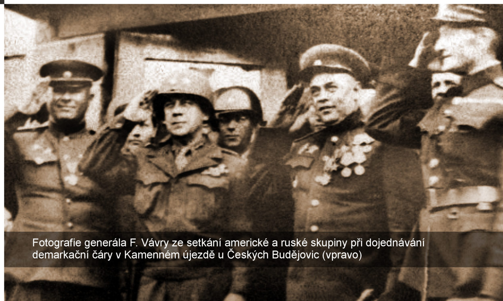
Fotografie generála F. Vávry ze setkání americké a ruské skupiny při dojednávání demarkační čáry v Kamenném újezdě u Českých Budějovic (vpravo)